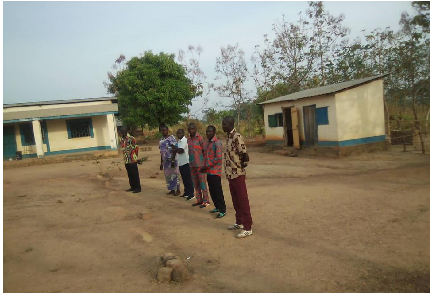
Les enseignants de l'Ecole de Bossangoa

L'Equipe pédagogique : 1 directeur et 5 professeurs